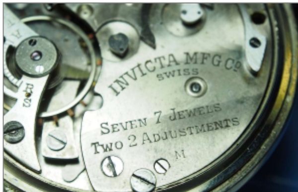
o. Das »M« weist auf ein Metallgehäuse hin. Abb. rechts und unten: Das Patent von 1910